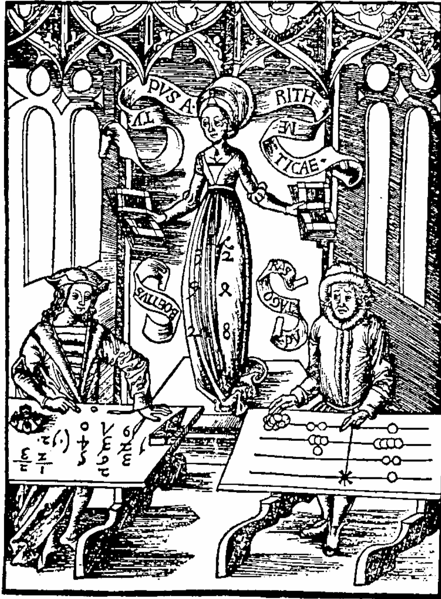
Brett- und Ziffernrechner

Zur Linken der Arithmetica sitzt Pythagoras vor einem Linienbrett, auf dem die Zahlen 1241 und 82 gelegt sind; zur Rechten Boethius vor Zahlen in indischen Ziffern. Das Mittelalter hielt, beidemal irrtümlich, diese Männer für die Erfinder der einen und der anderen Rechenweise. (Auf dem Gewand der Arithmetica die geometrischen Reihen 1 2 4 8 und 1 3 9 27.)